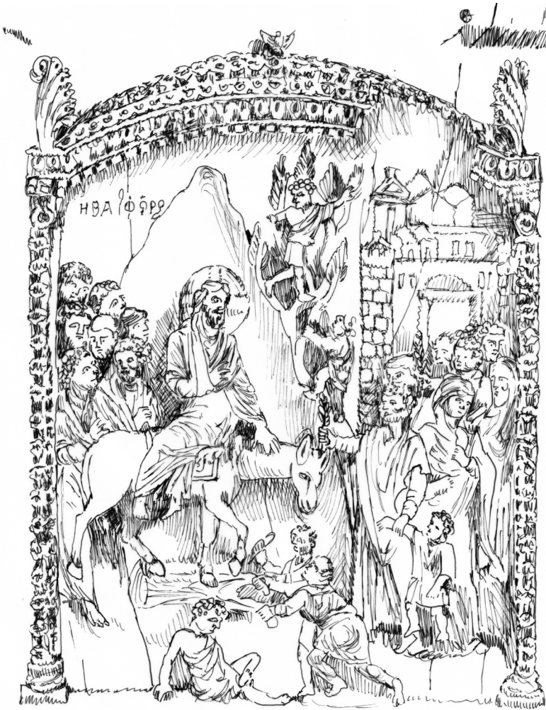
Jesus bei seinem Einzug in Jerusalem am Palmsonntag. Der Esel trägt den König und Friedensverkünder, wie vorausgesagt in Sacharja 9.9. Elfenbeinminiatur aus Konstantinopel, Istanbul, 10. Jahrhundert.